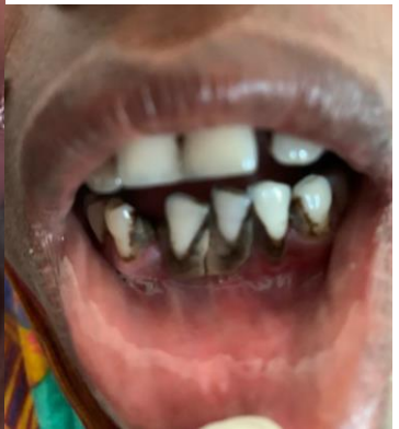
Photo de gauche : une dent a poussé derrière une autre, dans le palais. Il faut l'extraire !

Photo du milieu gauche : caries, dent cassée et dont il faut extraire les racines. . .