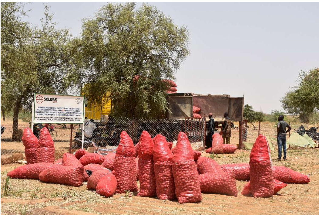
Chargement de la production d'oignons, Récolte 2022