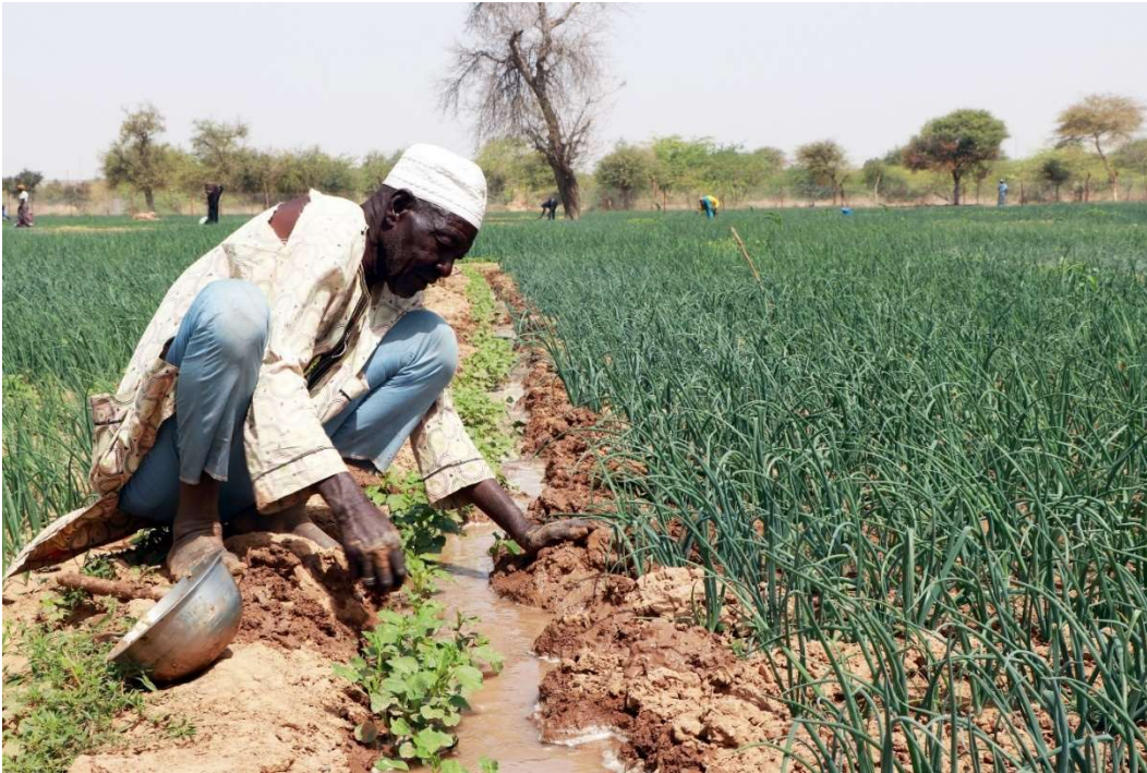
Producteur maraicher, bénéficiaire du PRECOS, occupé à l'irrigation de sa parcelle, 09 février 2023, © ZELUS Communication