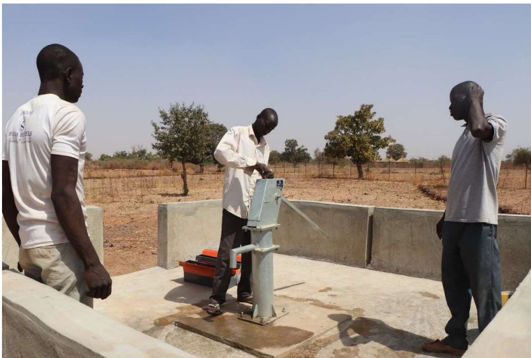
Formation sur la maintenance préventive du forage le 09 février 2023