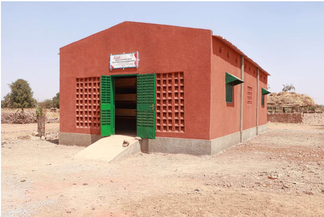
Vue extérieure du magasin de conservation d'oignons, 09 février 2023, © ZELUS Communication