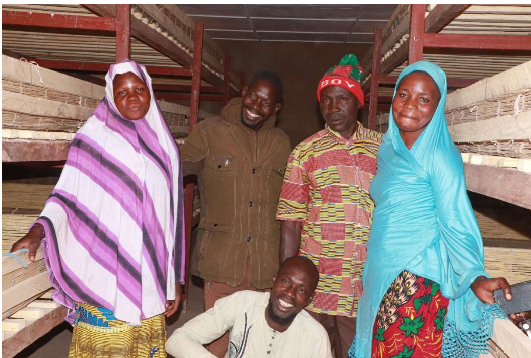
Vue de l'intérieur du magasin lors de la formation des membres de son comité de gestion le 09 février 2023, © ZELUS Communication